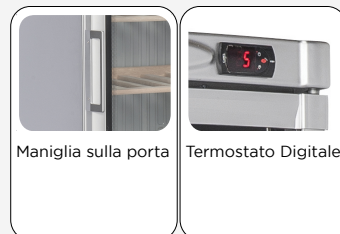
Maniglia sulla porta